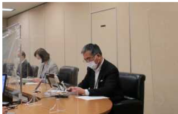
【北海道公安委員会定例会議】

北海道公安委員会では、国民からの一層の理解を得るため、定例会議の開催内容等のコンテンツを掲載したホームページを開設して情報を発信しています（各方面公安委員会もホームページを開設しています。）。