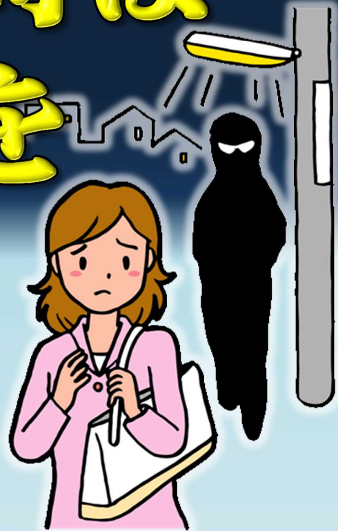
◆子供・女性被害強制わいせつ ①認知状況 (H26~30過去5年平均) ②多発時間帯 (単位:時間) ◆

特に夏場の夜間は、 Check! 女性を狙った強制わいせつ などの犯罪が増加傾向に!!