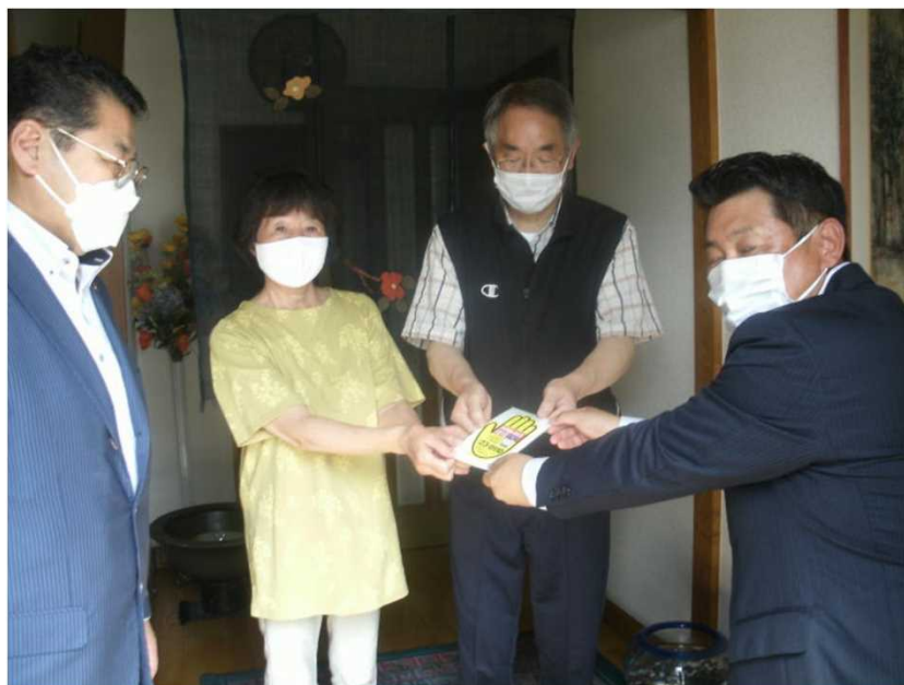
地域住民への配布の様子

北海道セキスイハイム防犯協力会では、特殊詐欺の被害を防止するため、固定電話機に貼付けできる、「特殊詐欺被害防止ポップ」を作成し、士別地区防犯協会連合会に寄贈するとともに、地域住民に配布して注意を喚起しました。