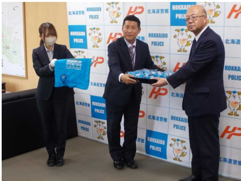
防犯エコバッグ贈呈式の様子

防犯エコバッグは、ショッピングセンターにおける街頭啓発において配布され、特殊詐欺に対する注意喚起に使用されました。