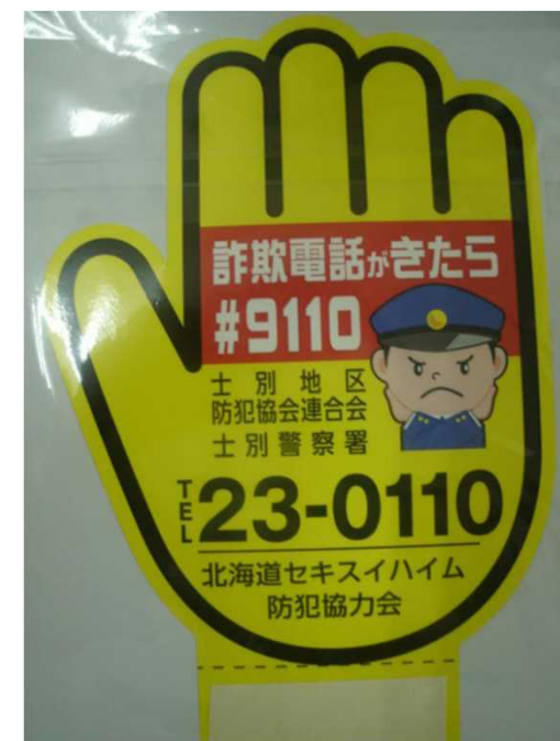
特殊詐欺被害防止ポップ