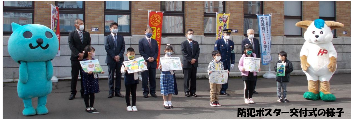
防犯ポスター交付式の様子

北海道コカ・コーラボトリング株式会社小樽営業課では毎年、小樽市内の小学一年生を対象に塗り絵形式の防犯ポスターを募集し、全ての応募作品を市内の自動販売機に掲示する活動に取り組み、地域住民の防犯意識の拡大と「安全安心まちづくり」の輪の広がりを目指しています。