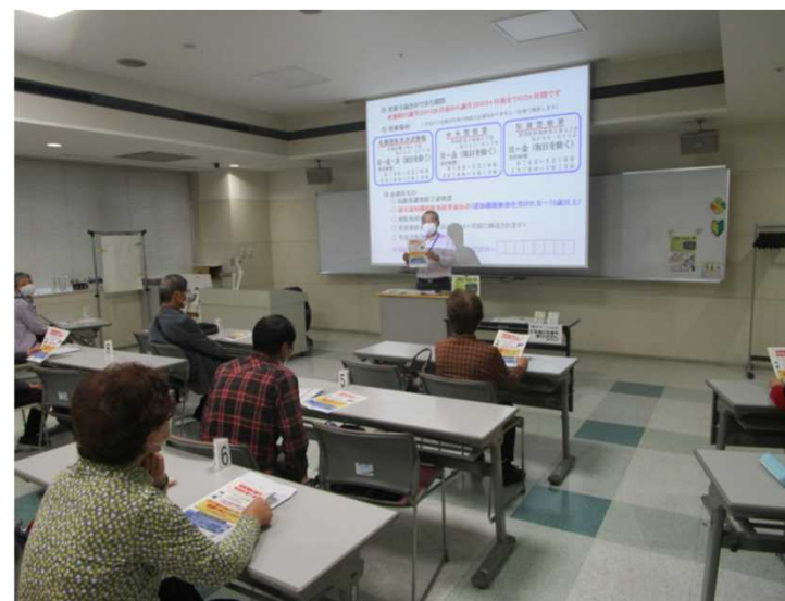
高齢者講習の様子