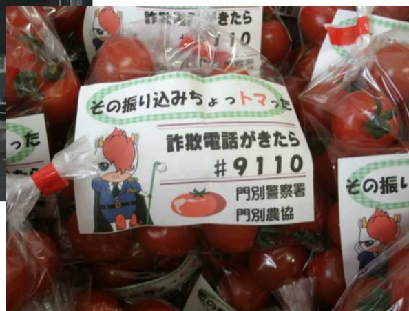
利用客に配布したミニトマト