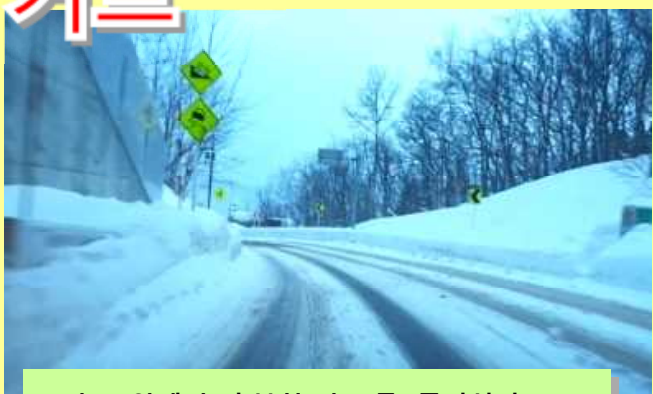
커브 앞에서 충분히 속도를 줄이십시오.