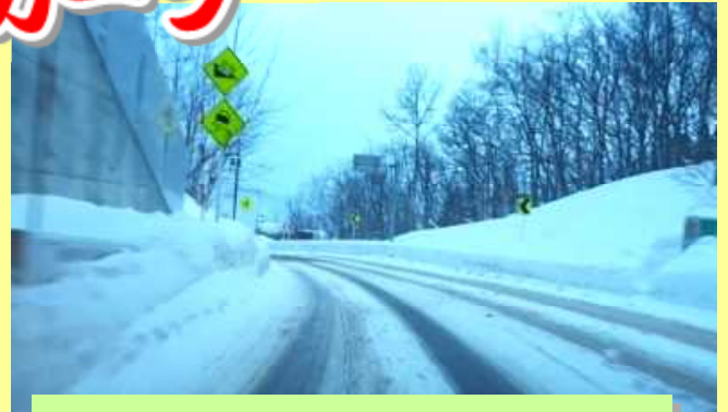
カーブ手前で十分な減速を