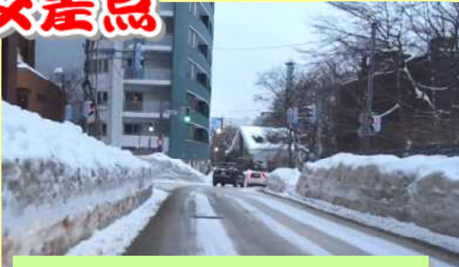
特に停止線手前で早めのブレーキを