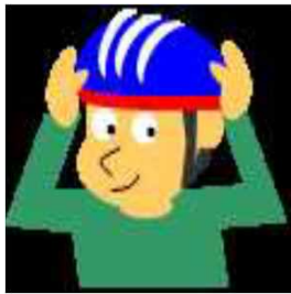
ヘルメット着用の励行