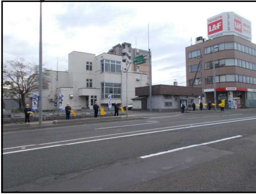
国道36号における旗の波