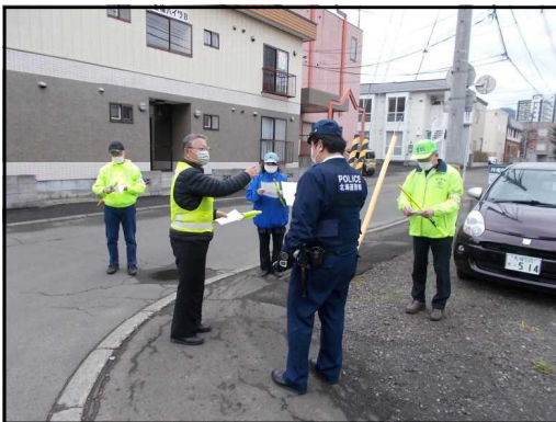
美園小学校付近における子どもの見守り