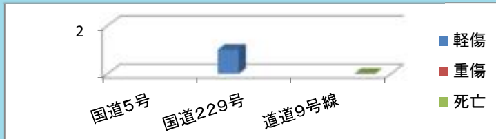
路線別・傷害別の人身交通事故発生状況(過去5年)

○ 路線別の人身事故発生状況は、国道229号で1件で発生しています。国道5号と道道9号線での発生はありませんでした。