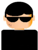
攻撃者 (A社のなりすまし)