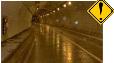
トンネル内の一部凍結