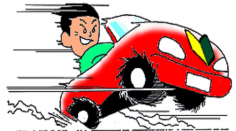
スピードの出し過ぎ