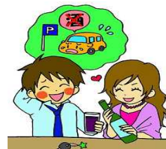
飲酒運転をするおそれのある人にお酒を提供