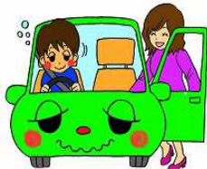
飲酒運転している人の車に同乗