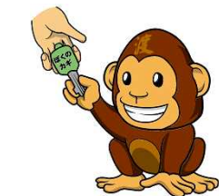
飲酒運転をするおそれのある人に車両を提供