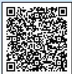
↑ 飲酒運転ゼロボックス

北海道警察では、悪質な飲酒運転を根絶するために「飲酒運転ゼロボックス」による飲酒運転情報や、飲酒運転根絶に向けたアイデアを受け付けておりますので、皆様のご協力をお願いします。