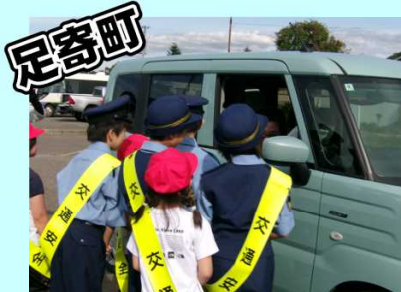
9月24日 交通安全啓発