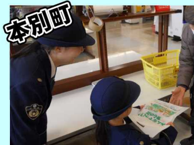
10月28日 特殊詐欺被害防止

本別警察署では、地域住民の皆さんが安全で安心して暮らすことのできる社会を実現するために、 各種啓発活動に取り組んでいます！