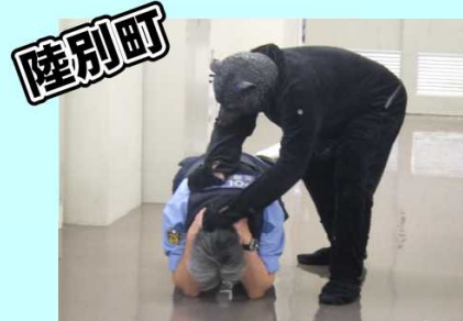
10月24日 ヒグマ対策訓練