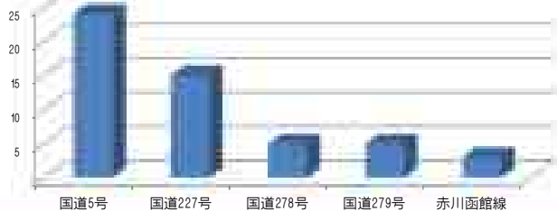
路線別の人身交通事故発生状況(過去5年、5月～10月)