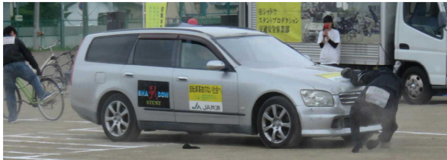
令和5年6月12日実施のスクエアドストレート(プロスタントマンによる事故の再現)