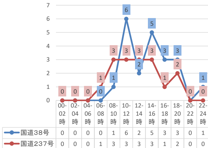
国道の時間帯別人身事故発生状況

○過去5年間(5月～10月)における国道の時間帯別の人身事故発生件数では、国道38号と国道237号ともに