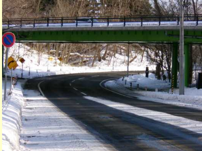
(事故発生当時の路面は凍結状態)

この事故で、けが人は出ませんでしたが、路面に合わせた、安全運転を心掛けましょう。