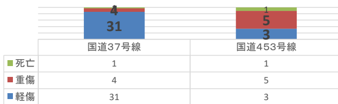
路線別人身事故発生状況（過去5年 5月～10月）

● 過去5年の5月から10月までの人身事故発生状況をみると国道37号での発生が多いです。