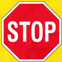
International Traffic Sign 國際標誌 / 국제표시