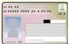
①マイナカードのみ