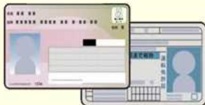
②マイナカードと免許証の両方持ち