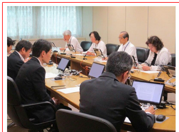
【北海道公安委員会定例会議】

北海道公安委員会では、国民からの一層の理解を得るため、定例会議の開催内容等のコンテンツを掲載したホームページを開設して情報を発信しています（各方面公安委員会もホームページを開設しています。）。