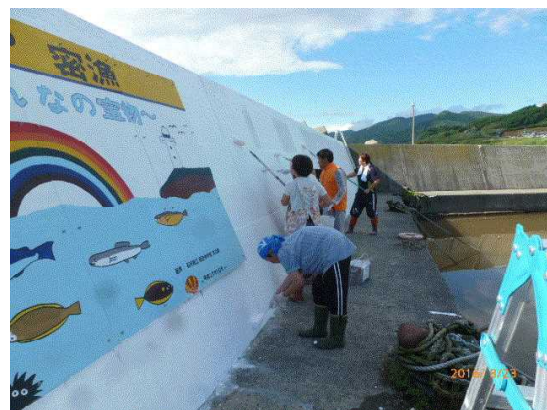
もう少しで完成です