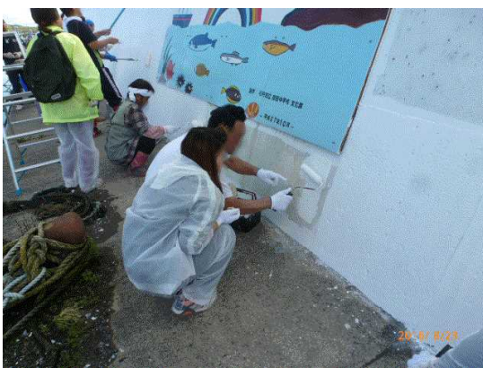
職人さんに教わりながら慎重に塗っています