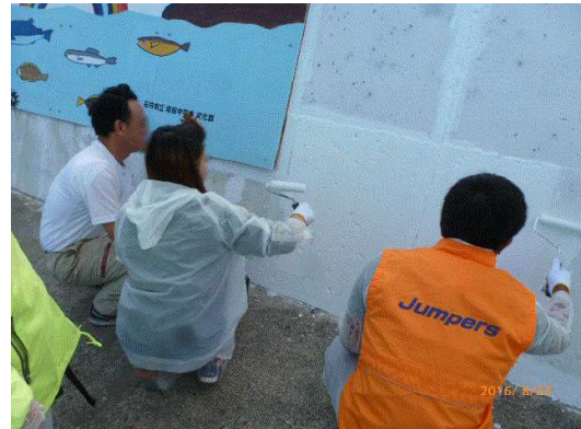
「Jumpers」（大学生ボランティア）と一緒に作業しました