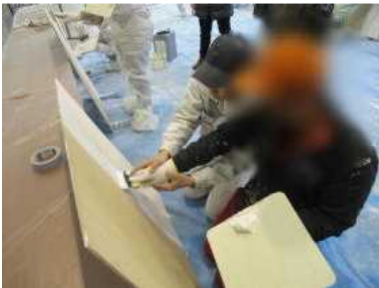
コツを教えてもらいました

少年からは「難しかった」「楽しかった」などの感想が寄せられ、先生からも「初めての割に刷毛の使い方が上手」「すごい集中力だね」などと褒めていただき、少年も嬉しそうにしていました。