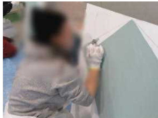
はみ出ないように慎重に…