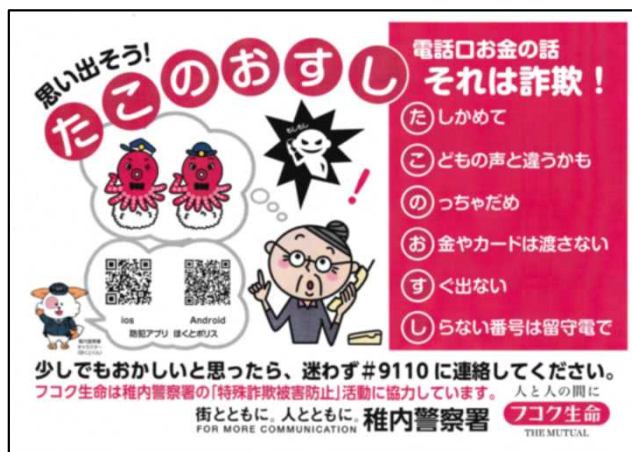
ポケットティッシュ用チラシ

富国生命保険相互会社旭川支社稚内営業所では、防犯標語を活用した特殊詐欺被害防止チラシを作成し、顧客への注意喚起を行っています。