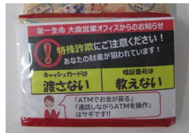
ポケットティッシュのラベル