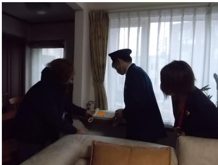
警察官とともに顧客宅の留守番電話設定を行っている状況