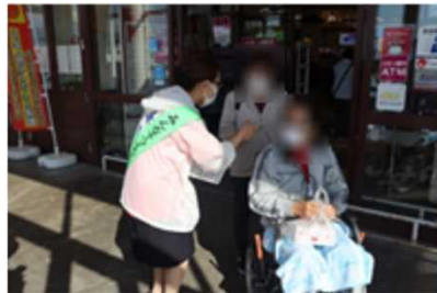
啓発活動参加の様子