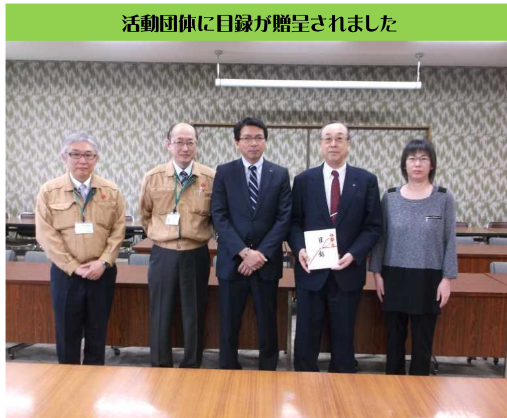
活動団体に目録が贈呈されました