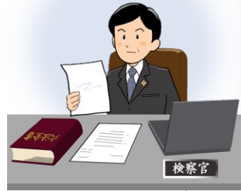
Kiểm sát viên

Ngoài ra, trường hợp chỉ gửi hồ sơ đến Viện kiểm sát mà không bắt giữ nghi phạm, Kiểm sát viên sẽ quyết định có xét xử nghi phạm hay không sau khi kết thúc các điều tra cần thiết.