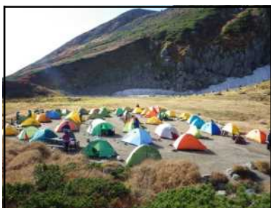
白雲岳キャンプ場の状況

この時期、日中は日差しがあっても暖かくも、朝晩は冷え込みます。また、日没時間も早まっていますので、十分な防寒対策とヘッドライトなどの照明器具を携行するように心がけましょう。