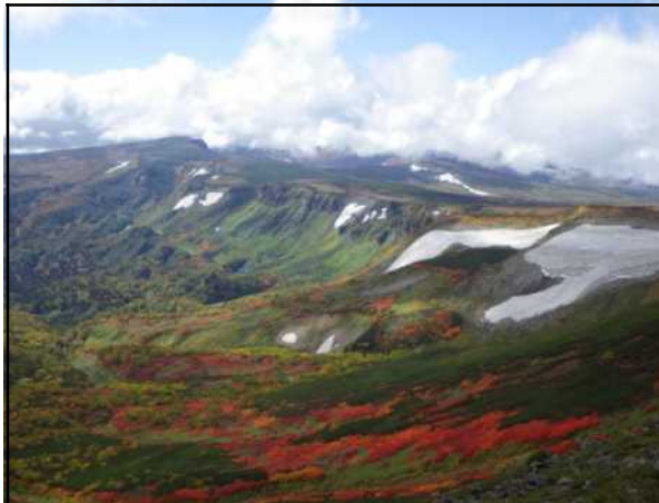
緑岳から見る紅葉の状況(9/16)