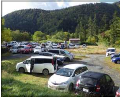
高原温泉登山口の状況