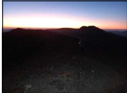
「間宮岳」から見る朝焼け