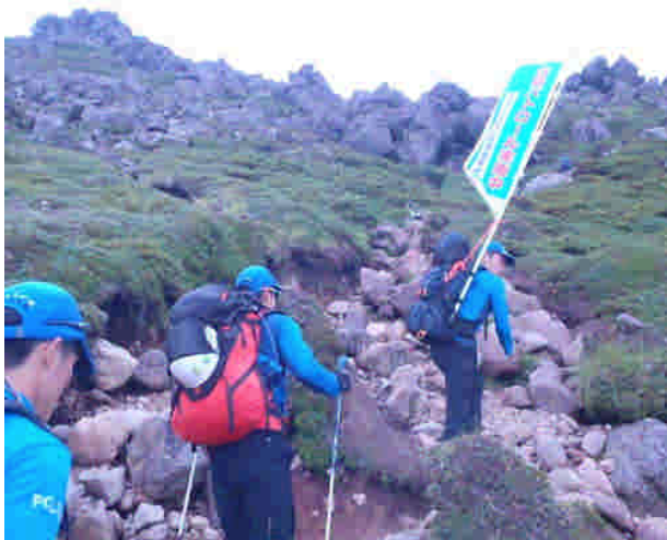
山岳パトロールの状況