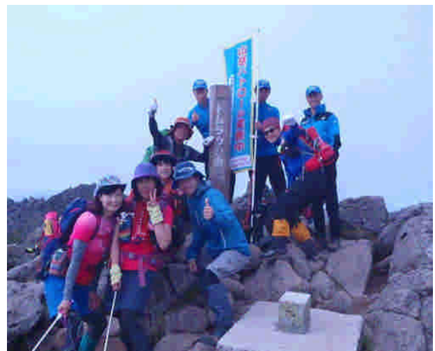
山頂での啓発活動の状況