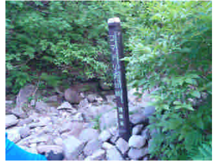
コマドリ沢分岐の状況