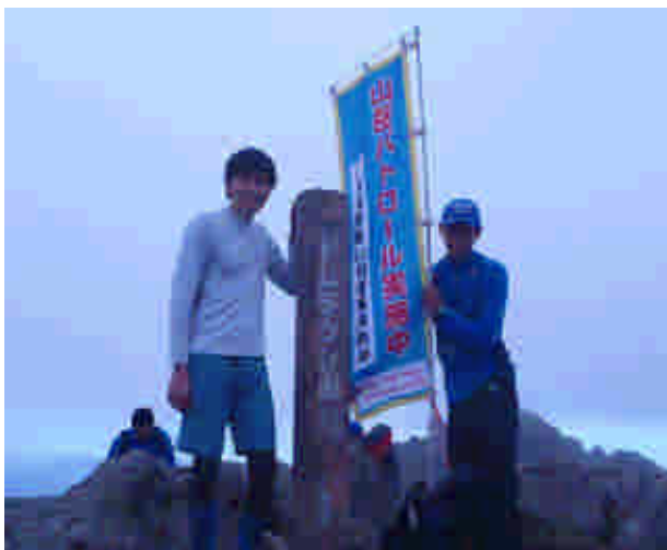
山頂での啓発活動状況