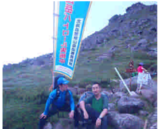
安全登山の呼びかけ