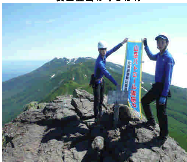
山頂での啓発活動の状況