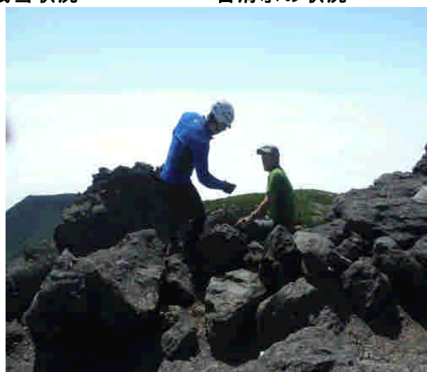
安全登山の呼びかけ