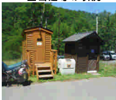
登山口にあるトイレの状況