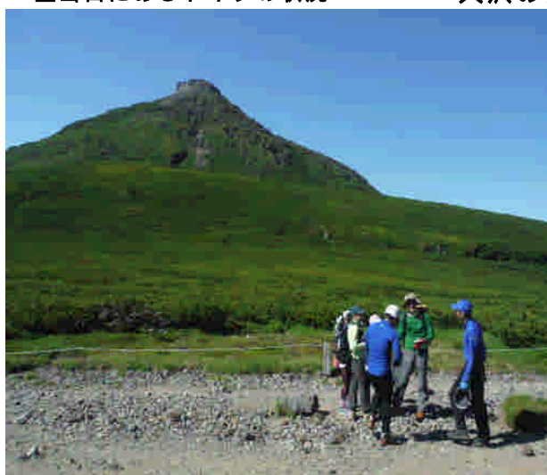
安全登山の呼びかけ