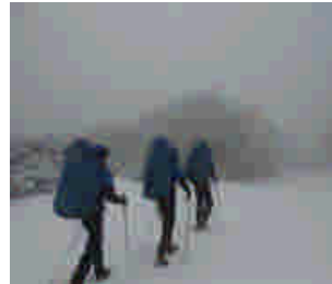
安政火口への登山道