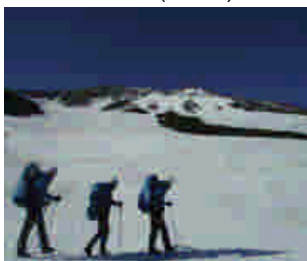
美瑛岳分岐・ポンピの沢付近の残雪の状況