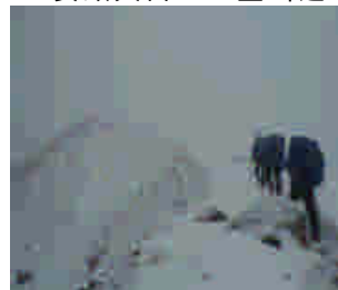
十勝岳へ向う稜線