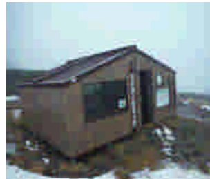
美瑛富士避難小屋