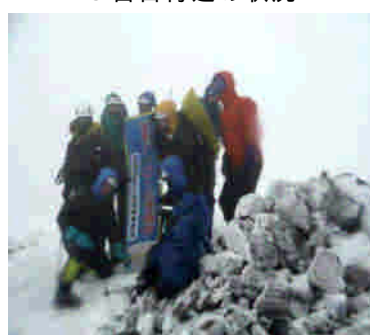
山頂での啓発活動状況