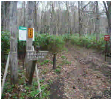
比羅夫コース登山口の状況