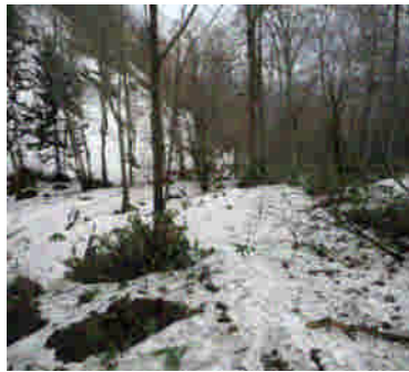
2合目付近の残雪状況