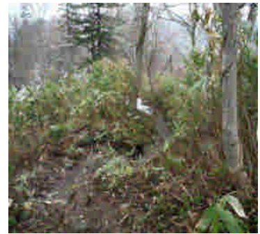
2合目付近の登山道の状況