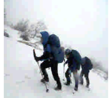
8合目付近の登坂状況