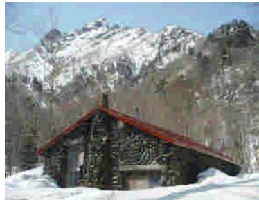
ユーフレ小屋（標高620m付近）