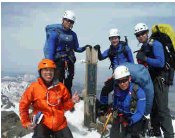
芦別岳山頂での啓発活動