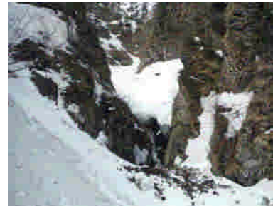
ゴルジュ（標高690m付近）