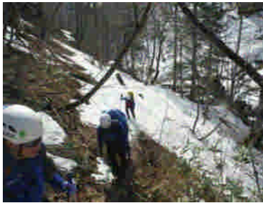
勇振川左岸（旧道登山道）