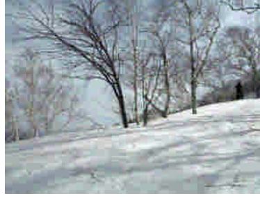
鶯谷（覚太郎コース分岐）