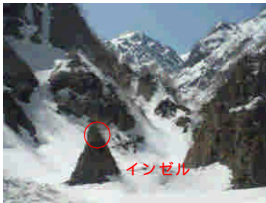
通称「インゼル」の状況