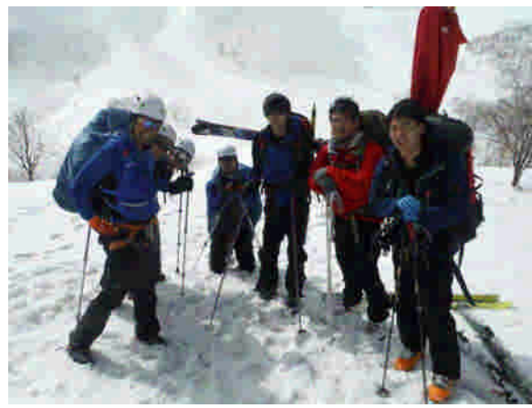
半面山での啓発活動