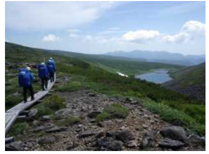
縦走路とヒサゴ沼