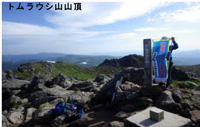
トムラウシ山山頂