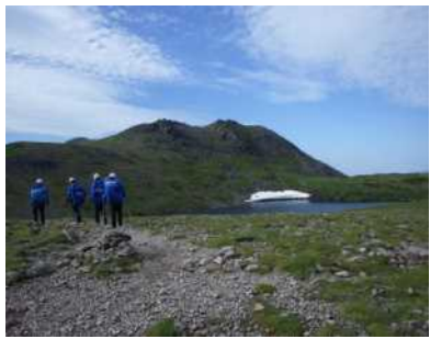
北沼とトムラウシ山頂