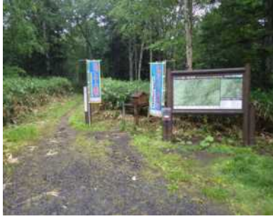
短縮コース登山口