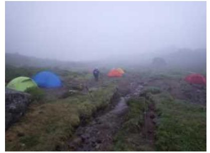
南沼キャンプ指定地