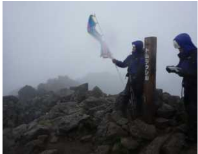
トムラウシ山山頂