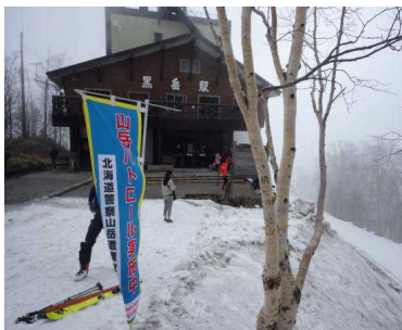
ロープウェイ黒岳駅(5合目)