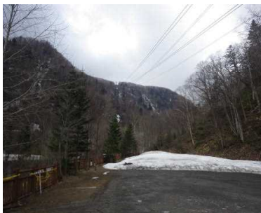
黒岳山麓駅から黒岳駅方向