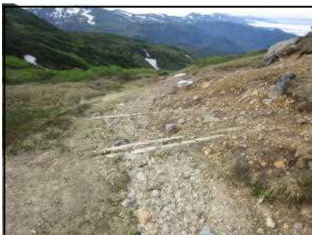
旭岳姿見駅から下山する登山道の状況