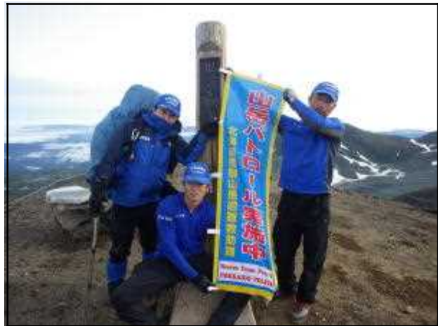
旭岳山頂の状況 (7/7) (天候くもり、気温 8^{\circ}\text{C} 、風速 1\text{m} )