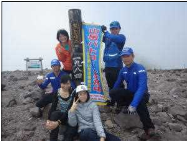
黒岳山頂の状況 (7/6) (天候くもり、気温 13^{\circ}\text{C} 、風速 1\text{m} )