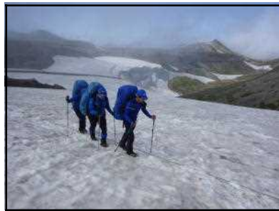
北海岳から白雲岳に至る登山道