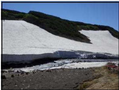
赤石川の残雪状況