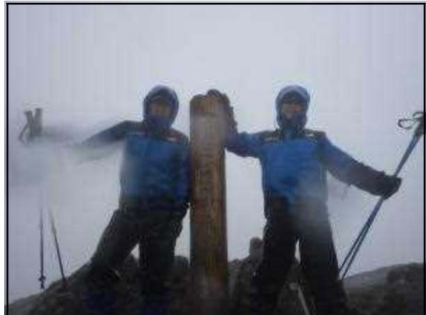
トムラウシ山山頂 (6/27) (天候雨、気温4℃、風速15m)