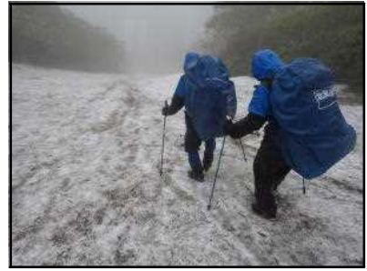
コマドリ沢に至る雪渓斜面