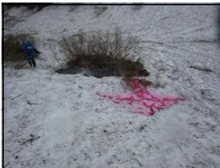
コマドリ沢の道迷い防止ペイント

この時期はまだ残雪がありますので、アイゼンの装着が必要です。 登山道が残雪に覆われて不明瞭な場所もあるので、ハンディGPS等を活用して道迷いの防止に努めましょう。