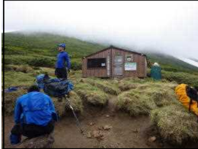
美瑛富士避難小屋