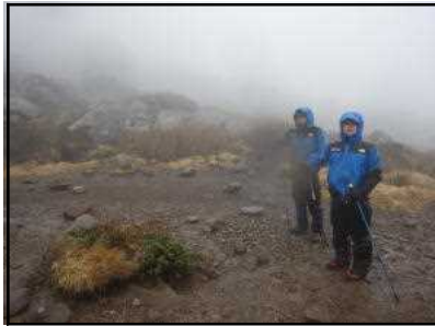
南沼キャンプ指定地