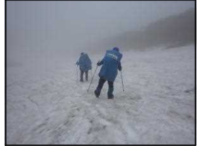
オプタテシケ山急斜面の残雪状況