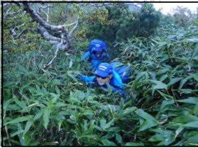
双子池付近の笹藪に覆われた登山道