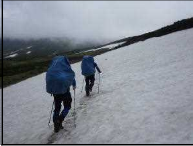
美瑛富士北側登山道の状況