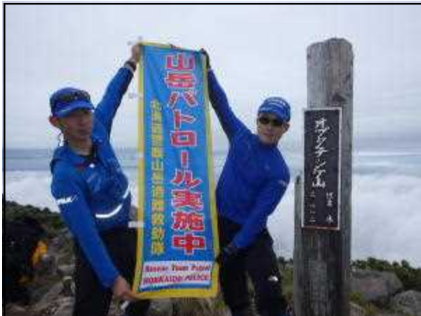
オプタテシケ山山頂 (6/26) (天候くもり、気温9℃、風速3m)