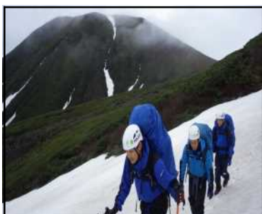
美瑛富士付近の状況