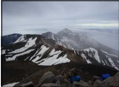
十勝岳から富良野岳方向の状況