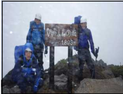
上富良野岳山頂の状況