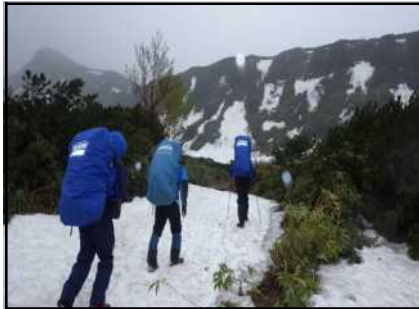
上富良野岳への登山道の状況