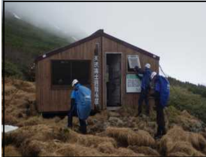
美瑛富士避難小屋の状況