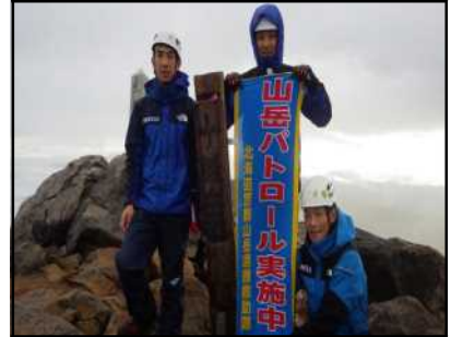
十勝岳山頂の状況