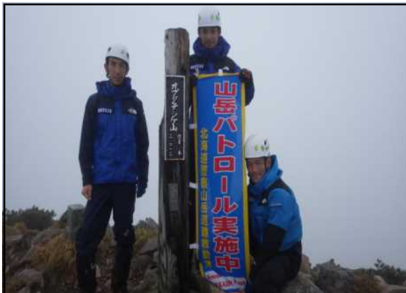
オプタテシケ山山頂での啓発状況