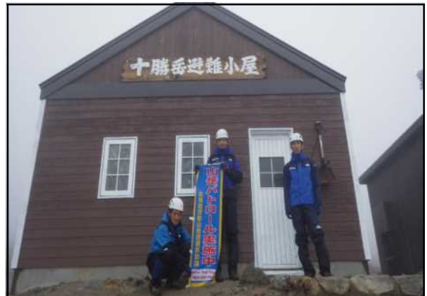
十勝岳避難小屋での啓発状況