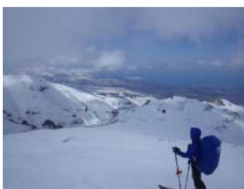
日本海を眺めながらの下山

日中、日差しが出て温くなると雪崩の発生も懸念されます。周囲をよく観察しながら慎重な行動に心がけるとともにビーコン、ショベル、ゾンデ棒などの雪崩対策装備も携行しましょう。