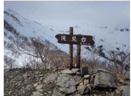
滝見台付近の状況