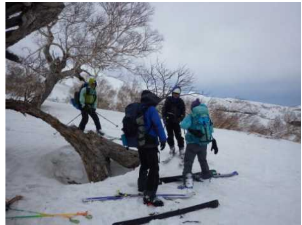
安全登山啓発の状況