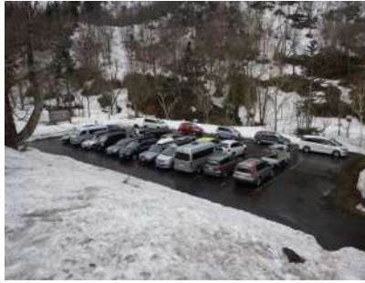
暑寒コース駐車場の状況