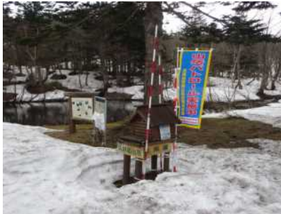
登山ポストの状況