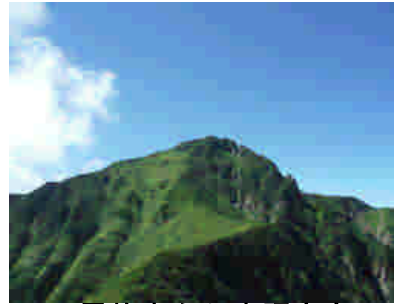
雲峰山から山頂方向