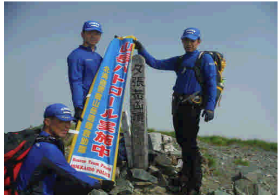
夕張岳山頂の状況