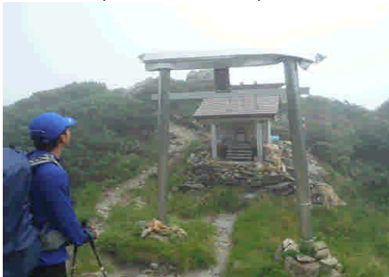
山頂直下の夕張岳神社の状況