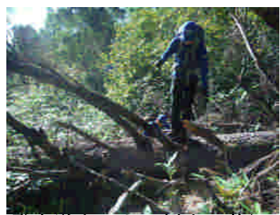
登山道上にある倒木の状況