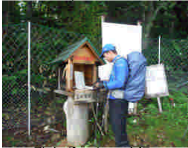
登山ポストの確認