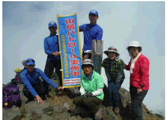
山頂での啓発状況