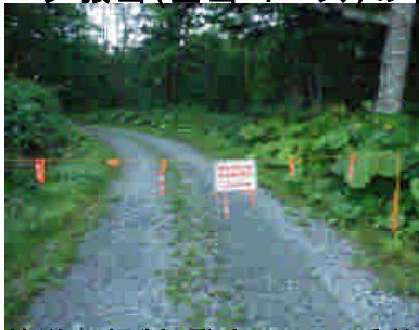
林道の規制(登山口2km手前)