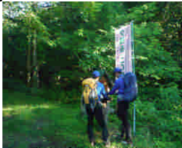
登山ポストの確認