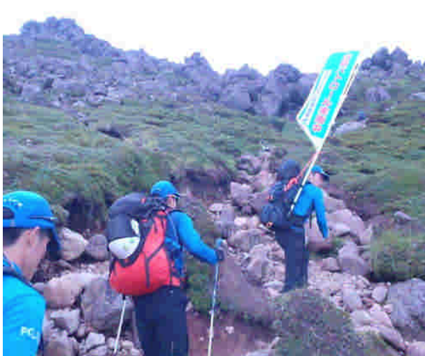
山岳パトロールの状況