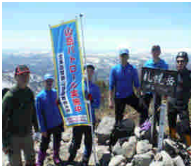
山頂での安全登山啓発状況