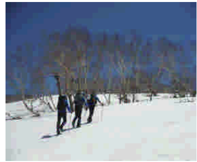
札幌岳上部の積雪状況