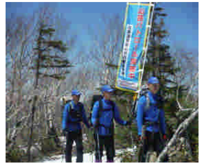
山岳パトロールの状況