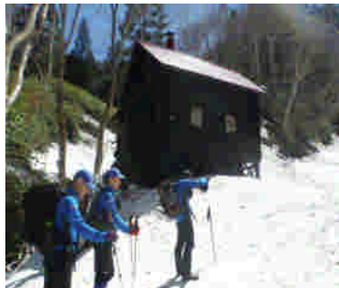
冷水小屋付近の状況