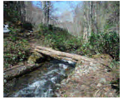
登山道にある橋の状況