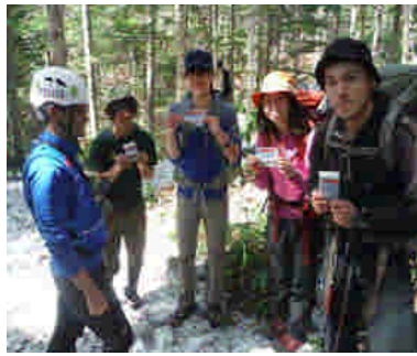
安全登山啓発状況