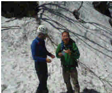
安全登山啓発状況